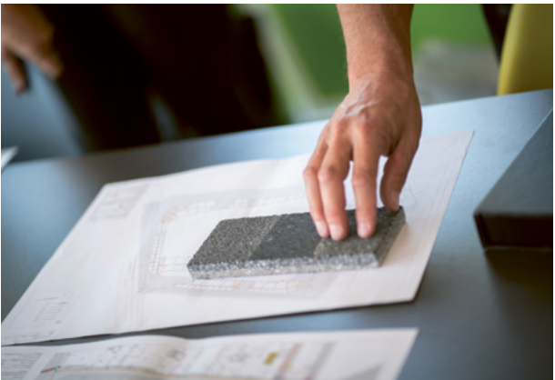
Bemusterung Quartiersplatz

Für die Gestaltung des zentralen Quartiersplatzes überlassen wir nichts dem Zufall – auch nicht die Farben und Körnigkeit der Pflasterungen. Deshalb gab es mit Vertreter*innen der Herstellerfirma, dem verantwortlichen Landschaftsarchitekturbüro Keller Damm Kollegen und der MWSP einen ersten Bemusterungstermin, um die Farben und Oberflächen der Trapezplatten für den Quartiersplatz abzustimmen. Ausgehend von der dunkelsten, granitfarbenen Mitte sollen darum liegenden Ringe nach außen hin immer heller werden.