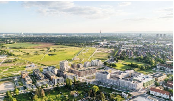
SPINELLI wächst weiter

Das SPINELLI-Gelände umfasst insgesamt 80,9 Hektar, von denen etwa 20 Hektar für den Städtebau vorgesehen sind. Der erste Bauabschnitt ist bekanntlich bereits abgeschlossen, aktuell sind weitere Grundstücke in der Vergabe. Bei der Bebauung soll weiterhin die Vielfalt des Quartiers dargestellt werden, weshalb auch hier auf Partnerschaften mit engagierten Projektentwicklern gesetzt wird. Die Grundstücke werden im Rahmen einer Konzeptvergabe vergeben, d. h. die Investoren müssen sich mit einem stimmigen Konzept für ein zu vergebendes Grundstück bewerben.