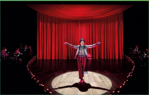
Dreigroschenoper im NTM Altes Kino FRANKLIN

Ins Theater gehen ist eine feine Sache, aber allein fehlt die Motivation? Ein Gruppenabonnement kann helfen: Ein gemeinsamer Besuch mit neuen Bekannten und Nachbar*innen im Theater macht gleich mehr Laune.