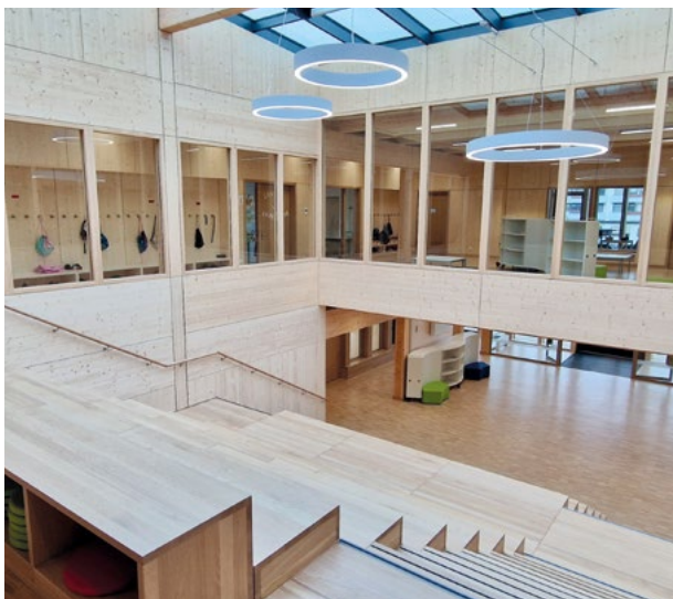
Innenansicht der SPINELLI Schule

Der Neubau punktet mit der Holzhybridbauweise, einer klaren Gestaltung und dem abwechslungsreich gestalteten Außenbereich für Bewegungspausen und Erholung. Sogar ein Klassenzimmer im Freien gibt es.