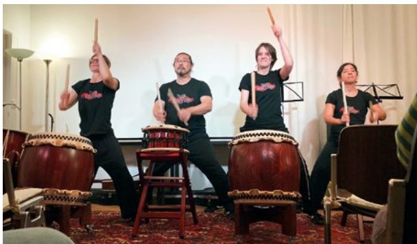
Taiko Heidelberg – japanische Trommeln – auf der Open Stage

Im Februar 2025 startete das Kulturprogramm des Vereins machbar e.V. mit einer „Open Stage“ im Mehrzweckraum des WohnWerk-Hauses. Die offene Bühne bietet eine Plattform für alle Laienkünstler*innen und Profis, die ihre kreativen Fähigkeiten einem Publikum präsentieren möchten. Interessierte Künstler*innen können sich per E-Mail unter openstage@machbar-ev-mannheim.de anmelden. Egal, ob Sie musizieren, tanzen oder Comedy darbieten möchten, hier sind Sie herzlich willkommen. Nutzen Sie die Gelegenheit, um Ihre Kreativität auszuüben und andere zu begeistern!