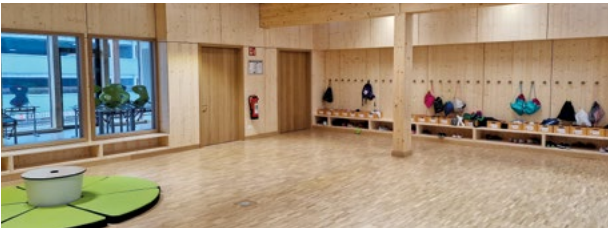
Innenansicht der SPINELLI Schule (©SPINELLI Schule; Foto: BBS)

Die Schule bietet für fast jeden Zweck geeignete Räume: Die Kinder können die Leseoase besuchen, im Bauzimmer aktiv werden oder in der Kreativwerkstatt mit der Kinderküche experimentieren. Zum Austoben und zur Erholung gibt es einen Bewegungsraum sowie einen Ruheraum. Auch die beiden sehr beliebten zertifizierten Schulhunde Luzy und Lotta haben sich schon eingelebt. Jedes Schulhalbjahr werden neue Mitmachangebote geschaffen: von Handwerk über Sport und Spiel bis hin zur Lese-AG und einem Hundekurs.