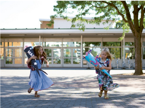
Elementary School FRANKLIN

Arbeitskräftemangel, Materialknappheit und abgerissene Lieferketten – die Schwierigkeiten, mit denen der Bausektor zu kämpfen hat, sind vielfältig. Bei der Spinelli-Grundschule haben sie nun alle Zeitpuffer zu-nichte gemacht: Die als Holzhybridbau geplante Schule kann erst ab 2024 genutzt werden. In insgesamt drei Ausschreibungsrunden für die maßgeblichen Holzbauarbeiten bekamen die Bildungsbauspezialisten der BBS nicht mal ein Angebot – das kostete, zusammen mit Verzögerungen bei den Fensterbauarbeiten, insgesamt neun wertvolle Monate, die bis zum ersten Schultag am 11. September schlicht nicht mehr aufzuholen sind.