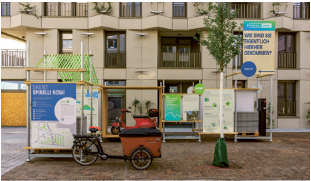
Themenpavillon Mobilität

Seit 16. Mai stehen fünf Pavillons mitten im Quartier und zeigen, was hinter SPINELLI steckt. Die Outdoor-Installation SPINELLI NOW! ist auf dem Chisinauer Platz und in der Völklinger Straße rund um die Uhr frei zugänglich. Was zeichnet nachhaltigen Städtebau aus, welche Konzepte sorgen für nachhaltige Architektur, wo entstehen wertvolle Beiträge zur Ökologie, wie wichtig sind die öffentlichen Freiräume für das soziale Miteinander – und wie setzen alternative Mobilitätsformen die Menschen in Bewegung? Das und vieles mehr erfahren Sie noch das ganze Jahr lang beim Erkunden von SPINELLI NOW!