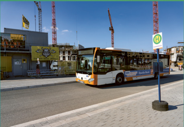
Haltestelle Chisinauer Platz

Die Premiere haben sicher viele verschlafen: Am 14. April um 5:37 Uhr hielt zum ersten Mal ein Bus an der Haltestelle Chisinauer Platz. Seitdem verläuft die Buslinie 53 über SPINELLI und pendelt täglich ab 5:37 Uhr (an den Wochenenden ab 5:48 Uhr) bis kurz vor Mitternacht zwischen den Endstellen Käfertal/Im Rott und Mannheim/Kurpfalzbrücke. Im 20-Minuten-Takt haben die Bewohner*innen somit Anschluss an den ÖPNV – am Bahnhof Käfertal beispielsweise auch an die Stadtbahnlinien 5 und 15 oder am DB-Bahnhof an die S-Bahn.