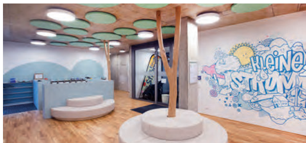
Gruppenraum der Kleinen Stromer