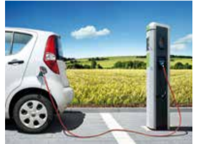
blue_village_mannheim steht für saubere Energie und emissionsfreie Mobilität und ist ein strategischer Ansatz zur Entwicklung der Konversionsflächen.