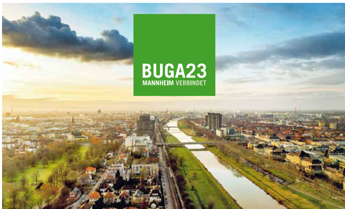
Die BUGA 2023 ist ein Projekt der Konversion, um den Grünzug Nord-Ost zu verwirklichen.