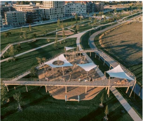
Spielstation Vernetzung im Spinelli-Park.

Die BUGA 23 ist vorbei, aber der Spinelli-Park steht den Bewohner*innen von SPINELLI sowie allen Bürger*innen der Stadt in weiten Teilen demnächst wieder offen. Die „Große Weite“ westlich der Völklinger Straße, der Panoramasteg und das Augewässer, vor allem aber die Spiel- und Bewegungsangebote in der Parkschale Käfertal laden an sonnigen Wintertagen zu ausgedehnten Spaziergängen oder abwechslungsreichen Balancier-, Rutsch-, Schaukel- und Klettertouren ein.