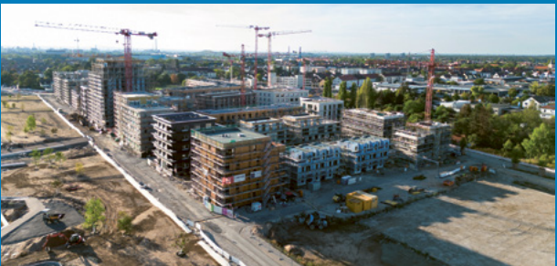
Blick auf SPINELLI

Während im Studierendenwohnheim Young Spinelli die Bewohner*innen ihre Umzugskisten auspacken, erfolgen in den umliegenden Gebäuden die Bauabnahmen. Wichtigste Voraussetzung dafür: die fertigen Gebäudestromanschlüsse – nur damit dürfen auch die Fahrstühle in Betrieb genommen werden. Baustrom ist auf SPINELLI also bald Geschichte. Genau wie die Gerüste, die nach und nach abgebaut werden und den Blick auf außergewöhnliche Fassaden freigeben. Nur beim Hochpunkt und am Quartierszentrum bleiben sie noch eine Weile stehen. Und sonst? Die Garten- und Landschaftsbauer arbeiten an den grünen Gemeinschaftshöfen, die letzte Baulücke wird dank Modulbauweise bald geschlossen sein. Was man von unten übrigens nicht sieht: Auf den Dächern sind die Photovoltaikanlagen und Dachbegrünungen größtenteils angelegt.