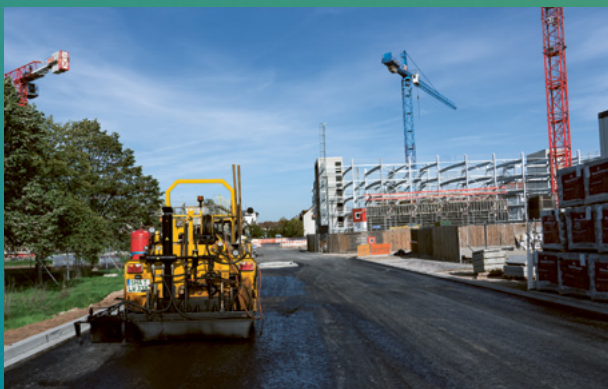
Asphaltierarbeiten um SPINELLI.

Der Straßenendausbau in und um SPINELLI schreitet voran. Endlich ist die Dürkheimer Straße wieder befahrbar, nur der südliche Gehweg auf Höhe der Quartiersgarage wird erst mit deren Fertigstellung endausgebaut. Mit der Völklinger Straße Nord geht es im Außenbereich von SPINELLI nahtlos weiter. Hier verläuft der künftige Radschnellweg, der eine komfortable Wegeverbindung zur Innenstadt, nach Viernheim und Weinheim ermöglicht. Die vier Meter breite Rad-Fahrbahn verläuft parallel zur Bebauung und wird mit einem Park- und Grünstreifen von der restlichen Straße abgetrennt. Innerhalb von SPINELLI arbeiten wir am Rest der Völklinger Straße. Auch auf dem Chisinauer Platz geht es nach acht Wochen Stillstand weiter. Hier musste die Planung für das Entwässerungskonzept zum Schutz einer Fernwärmeleitung überarbeitet werden. Im neuen Jahr heißt es dann: Alle Kräfte zum Quartiersplatz, auf dass er rechtzeitig fertig wird. Ein paar gedrückte Daumen nehmen wir neben den zusätzlichen Kapazitäten aber gern, um den Verzug aufholen zu können.