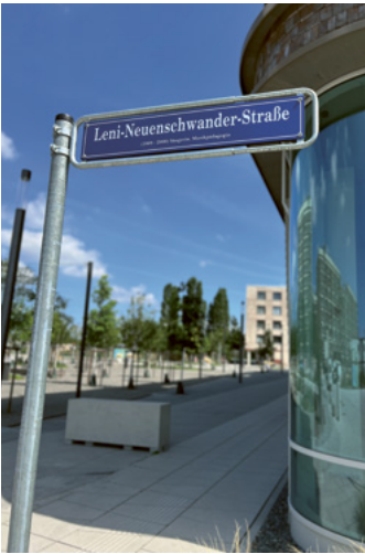
Gute Adresse: Leni-Neuenschwander-Straße