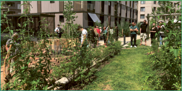
Eröffnungsfest im Gemeinschaftsgarten

So schnell kann eine Idee Gestalt annehmen: Inspiriert von den Naturgärten bei der BUGA23 reichten Bewohner*innen von OIKOS eG (Alice-Droller-Str. 5) im Oktober letzten Jahres einen Antrag auf Förderung eines Klimaprojektes ein. Anfang 2024 erhielten sie die Zusage und schon im Juni dieses Jahres wurde der neue Naturgarten gemeinsam mit der Nachbarschaft eingeweiht. Glückwunsch!