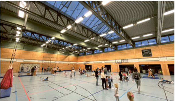
Macht auch in der Halle Spaß: Sport beim TV Käfertal

In den Abteilungen Faustball, Kinderturnen, Cricket, Gymwelt, Karate, Parkour, Kegeln oder Tennis können Sportbegeisterte jeden Alters aus einem breiten Angebot wählen. In der integrativen Spiel- und Sportgruppe, ISSG, treffen sich Menschen mit Handicap, um Sport und Spiel in der Gemeinschaft zu erleben. Der Verein wurde 1880 gegründet, wird seitdem komplett ehrenamtlich geführt und hat rund 900 Mitglieder.