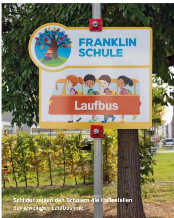
Schilder zeigen den Schülern die Haltestellen der jeweiligen Laufbuslinie.

Es gibt sieben Laufbuslinien, die den aktuellen Baustellentätigkeiten angepasst werden, um die Kinder sicher in die Schule und nach Hause zu führen. Wann steigt Ihr Kind ein? ■