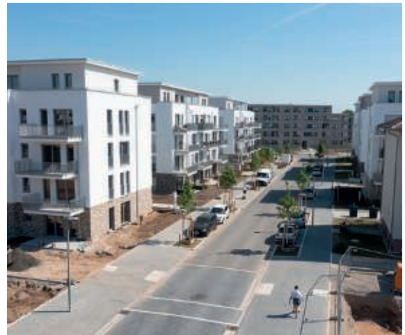
Die Franklin-D.-Roosevelt-Straße nach ihrer Fertigstellung.

Straßenbelag, Fußwege, Parkbuchten, neue Bäume und Straßenschilder: Die Franklin-D.-Roosevelt-Straße ist fertig ausgebaut. Ab sofort heißt es hier: freie Fahrt für alle! Natürlich nicht schneller als 20 km/h, versteht sich. ■