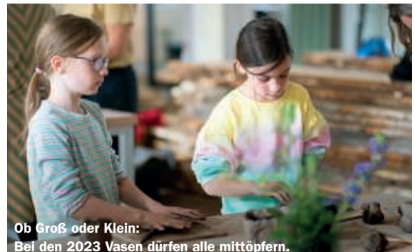
Ob Groß oder Klein: Bei den 2023 Vasen dürfen alle mittöpfeln.