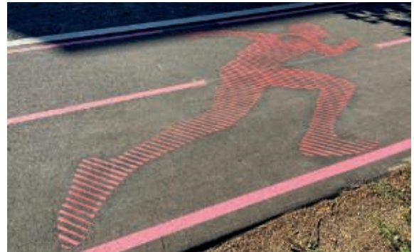
Macht Tempo: Die Grafik auf dem Loop.

Nachdem die Lücke im Loop Ende August geschlossen wurde, laufen mittlerweile die letzten Markierungsarbeiten. Im Bereich Grüne Mitte ist der zwei Meilen lange Rundweg nun fertig und bekommt mit einem Zitat und einem Läufer gerade den letzten Feinschliff. Im Zuge der Arbeiten ist auch die Außenanlage des Sprecherhauses an der FRANKLIN Sportanlage fertig. Hier liegen übrigens Start bzw. Ziel der insgesamt 3.218 Meter zum Laufen, Sprinten, Skaten, Radfahren und zum entspannten Flanieren. Auch beim FRANKLIN Meilenlauf am 09. Oktober wird der Loop natürlich wieder eine wichtige Rolle auf dem Weg zum Ziel spielen! ■